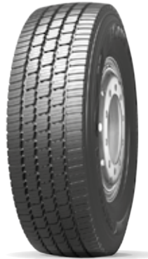
Neo Winter S