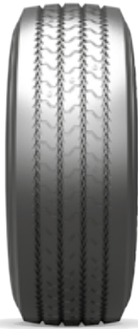
Neo Allroads T+