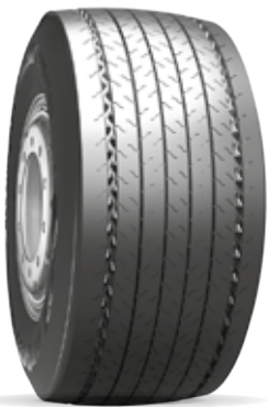
Neo Fuel T+